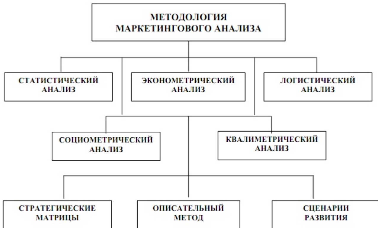
Рисунок 2 - Методы маркетингового анализа