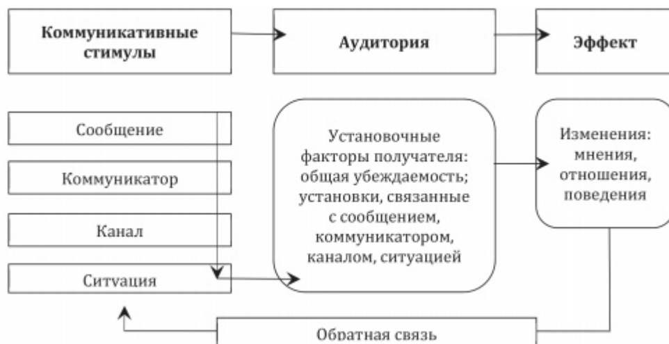
Рисунок 1 - Схема убеждающей коммуникации

Особенность матрицы К. Ховланда – А. Джаниса, строится за счет анализа наиболее значимых, базисных социально-психологических элементов процессов коммуникации в современном обществе. Передача информации в представленной схеме носит активный характер, претерпевает ряд трансформаций и, в целом, более активна на полюсе приемника (реципиента) представленной информации. Сущность представленной модели состоит в том, что все составляющие процесса коммуникации (кроме, естественно, целевой аудитории) должны рассматриваться как убеждающие стимулы. При этом эффективность стимулирующего воздействия во многом зависит от установочных факторов получателя информации и внутренних социальных процессов, протекающих в целевой аудитории (внимание, понимание, принятие решений) [11, с. 86].