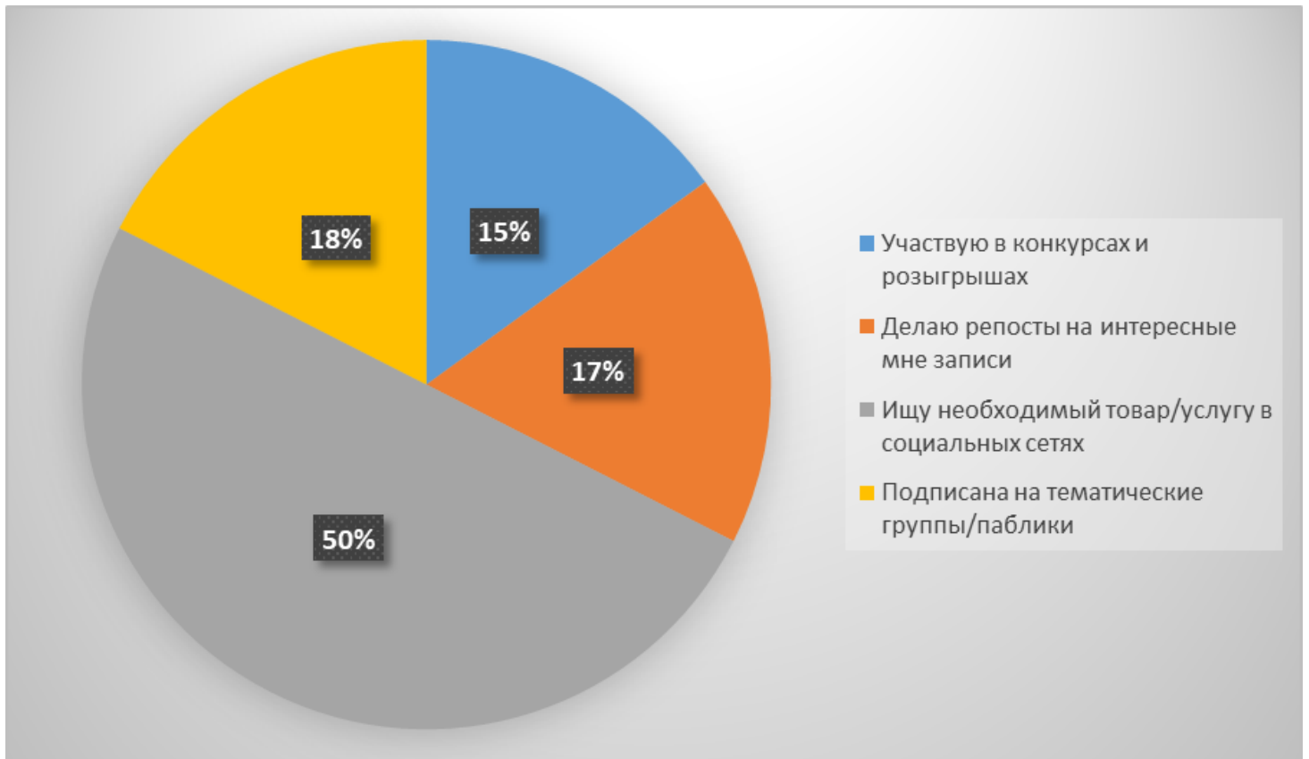
Рисунок 5. Виды активности в социальных сетях

Из полученных результатов видно, что 50% в социальных сетях ищут необходимый товар / услугу, остальные ответы были встречались реже и практически на равне.