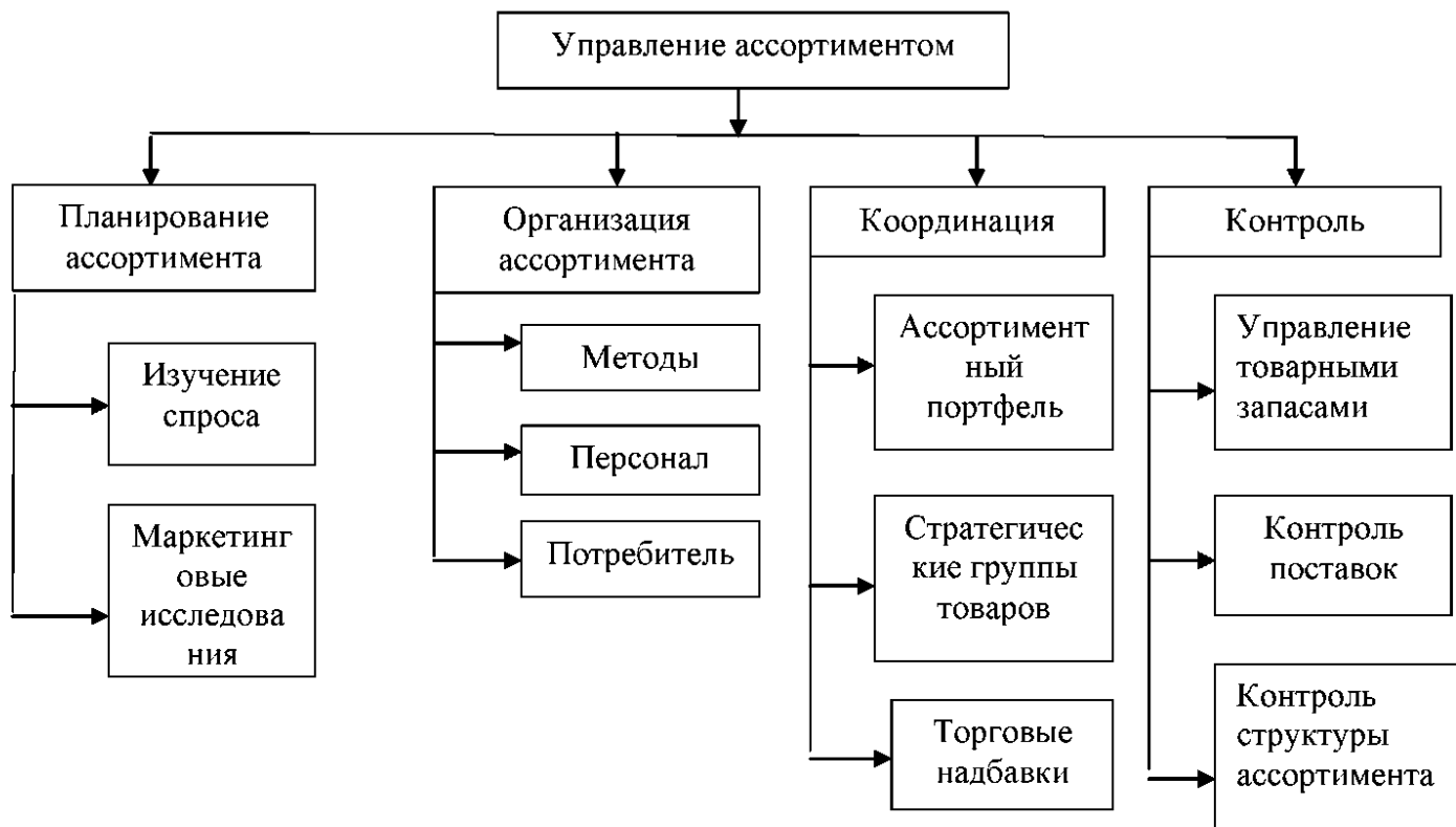
Рисунок 1. Структура функций ассортиментной политики организации