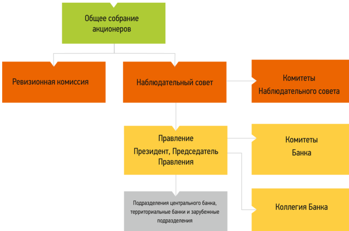
Рисунок 1 – Структура Сбербанка России