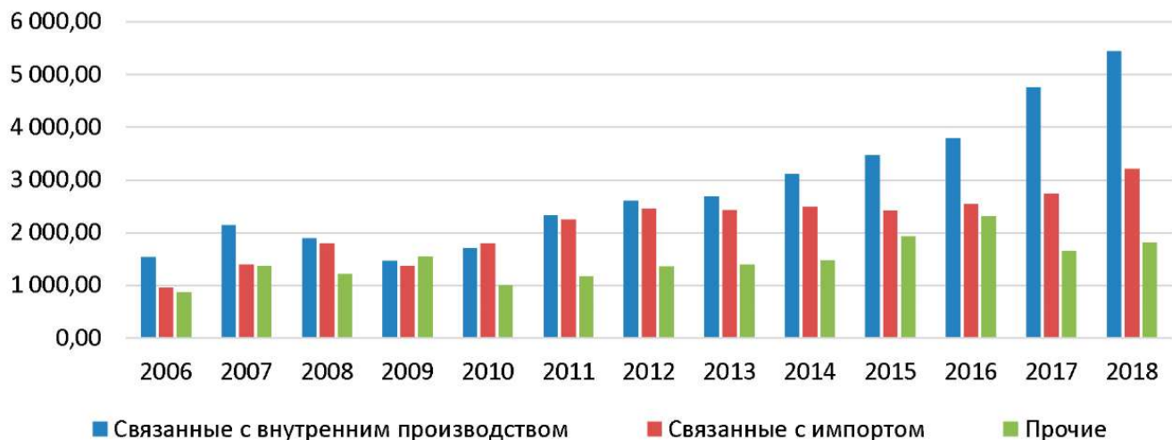
Рис. 2. Структура и динамика ненефтегазовых доходов федерального бюджета, млрд. руб.

В большинстве своём изменения в структуре нефтегазовых доходов вызваны изменением в объёмах добычи нефти и колебаний в стоимости нефти за баррель. Что касается стоимости нефти, то наиболее кризисный период начинается с 2014 года, когда начинаются первые предпосылки к падению цен, далее идёт их планомерное снижение вплоть до 2017 года, затем к концу 2017 года наблюдается повышение и относительная стабилизация цен на нефть в последующий год.