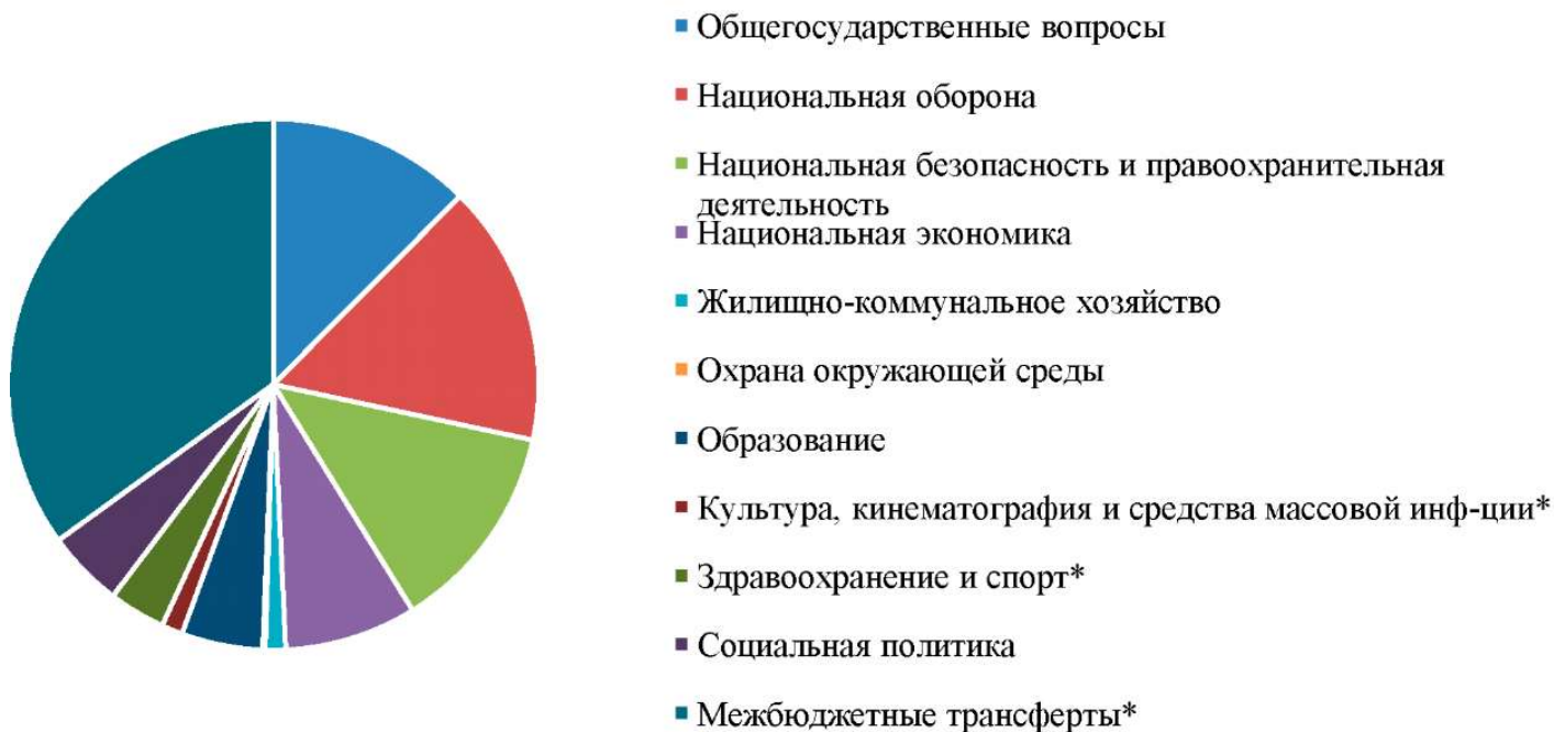
Рис. 3. Структура расходов федерального бюджета в 2006 году, млрд. руб.

За период с 2006 года по 2018 год в классификации расходов некоторые статьи изменялись: в большинстве случаев они разделялись, так, например, в 2006 году обслуживание государственного и муниципального долга включалось в состав общегосударственных вопросов, а в 2018 году - стало отдельной статьей в расходах.