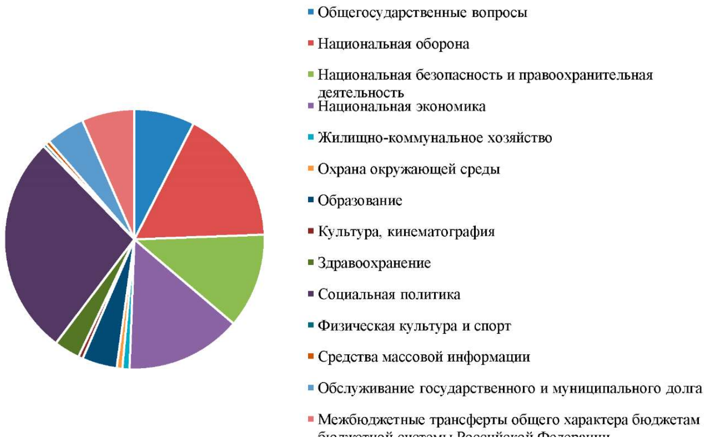
Рис. 4. Структура расходов федерального бюджета в 2018 году, млрд. руб.

Расходы на национальную оборону и национальную безопасность изменились в общем соотношении не так значительно - первая статья увеличилась на 1 %, а вторая - уменьшилась на 0,4 %.