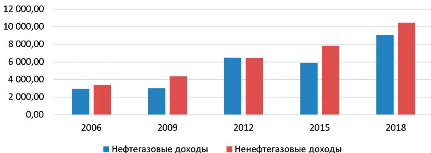
Рис. 1. Соотношение нефтегазовых и ненефтегазовых доходов федерального бюджета, млрд.руб.

Динамика доходов и расходов федерального бюджета Российской Федерации представлена в ежегодной информации об исполнении федерального бюджета, предоставляемой Министерством финансов.