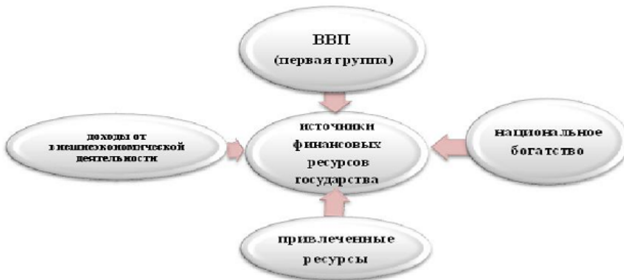
Рисунок 1 – Источники финансовых ресурсов государства на макроуровне

Таким образом, можно сделать вывод, наиболее приемлемым вариантом финансирования расходов государственного бюджета является выпуск государственных ценных бумаг. Традиционно с их помощью в мировой практике государством посредством эмиссии (выпуск) государственных ценных бумаг решаются следующие задачи: