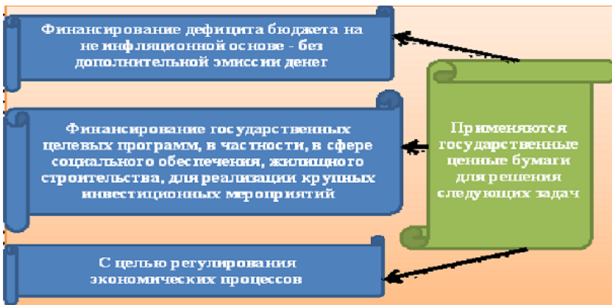
Рисунок 3 – Применение государственных ценных бумаг

Наиболее надежным инструментом финансового рынка и весьма доходным инструментом на рынке ценных бумаг являются государственные ценные бумаги, для государства - механизм ликвидации бюджетного дефицита и управления денежной массой; для инвесторов - выгодное направление инвестиций и существенные налоговые льготы (Рисунок №3).