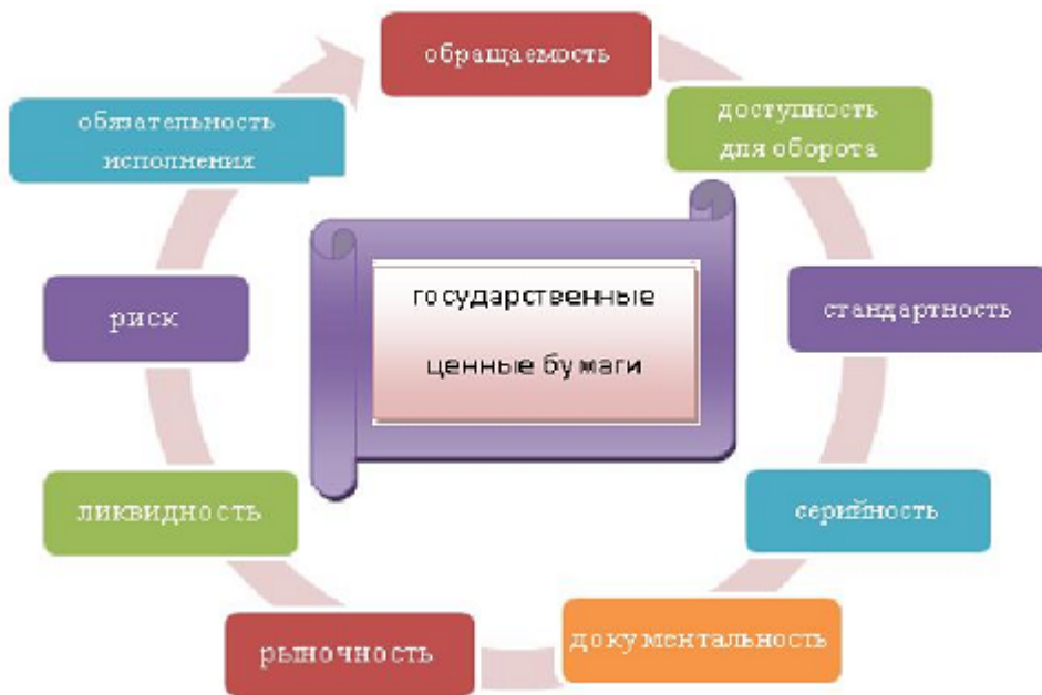
Рисунок 2 – Характеристика государственных ценных бумаг

Наиболее надежным инструментом финансового рынка и весьма доходным инструментом на рынке ценных бумаг являются государственные ценные бумаги, для государства - механизм ликвидации бюджетного дефицита и управления денежной массой; для инвесторов - выгодное направление инвестиций и существенные налоговые льготы (Рисунок №3).