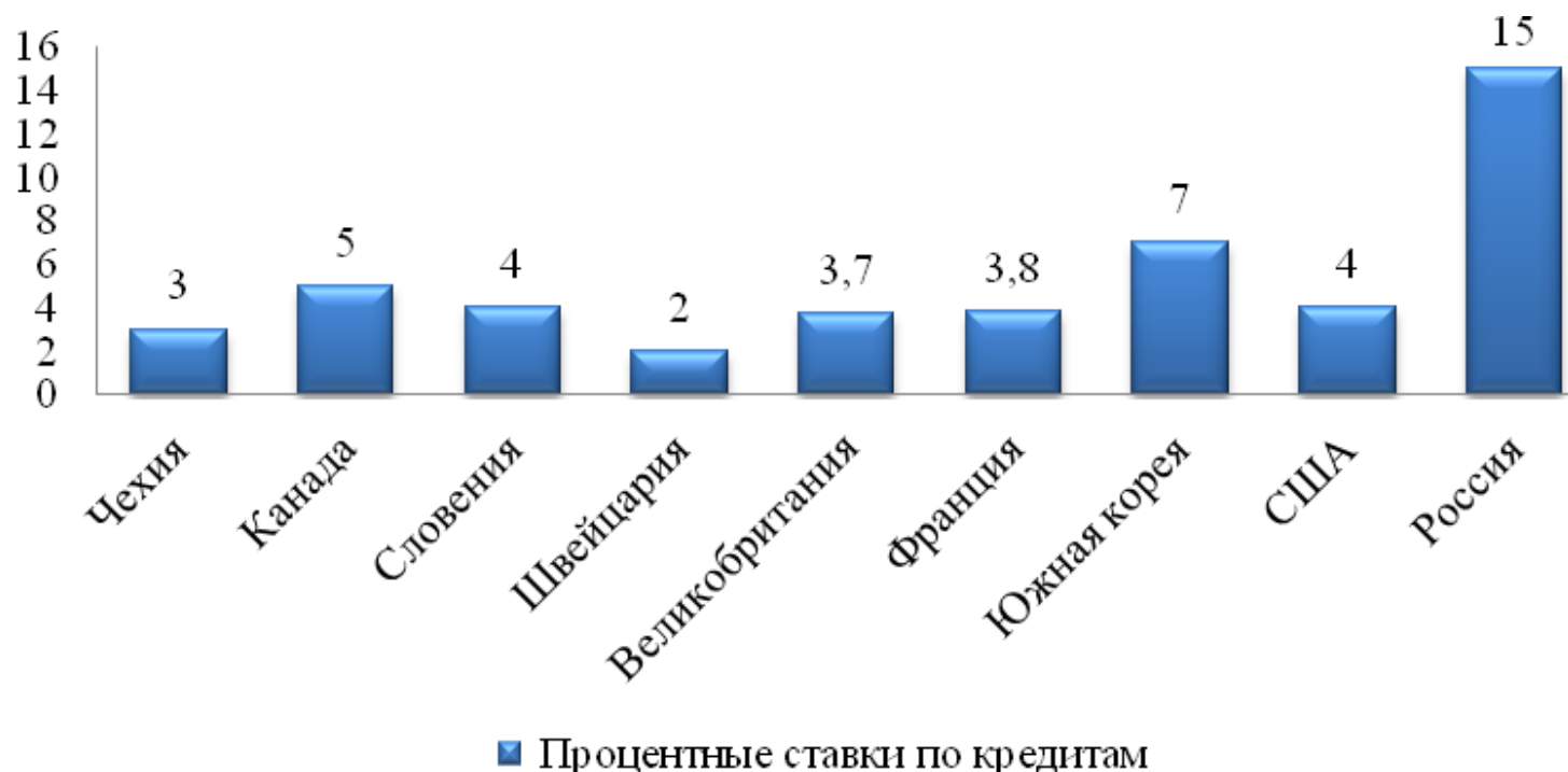
Рисунок 2.3. Процентные ставки по кредитам для малого бизнеса в России и ряде государств.

Представленные данные показывают, что начать свой бизнес за рубежом в разы проще, чем сделать то же самое в Российской Федерации.