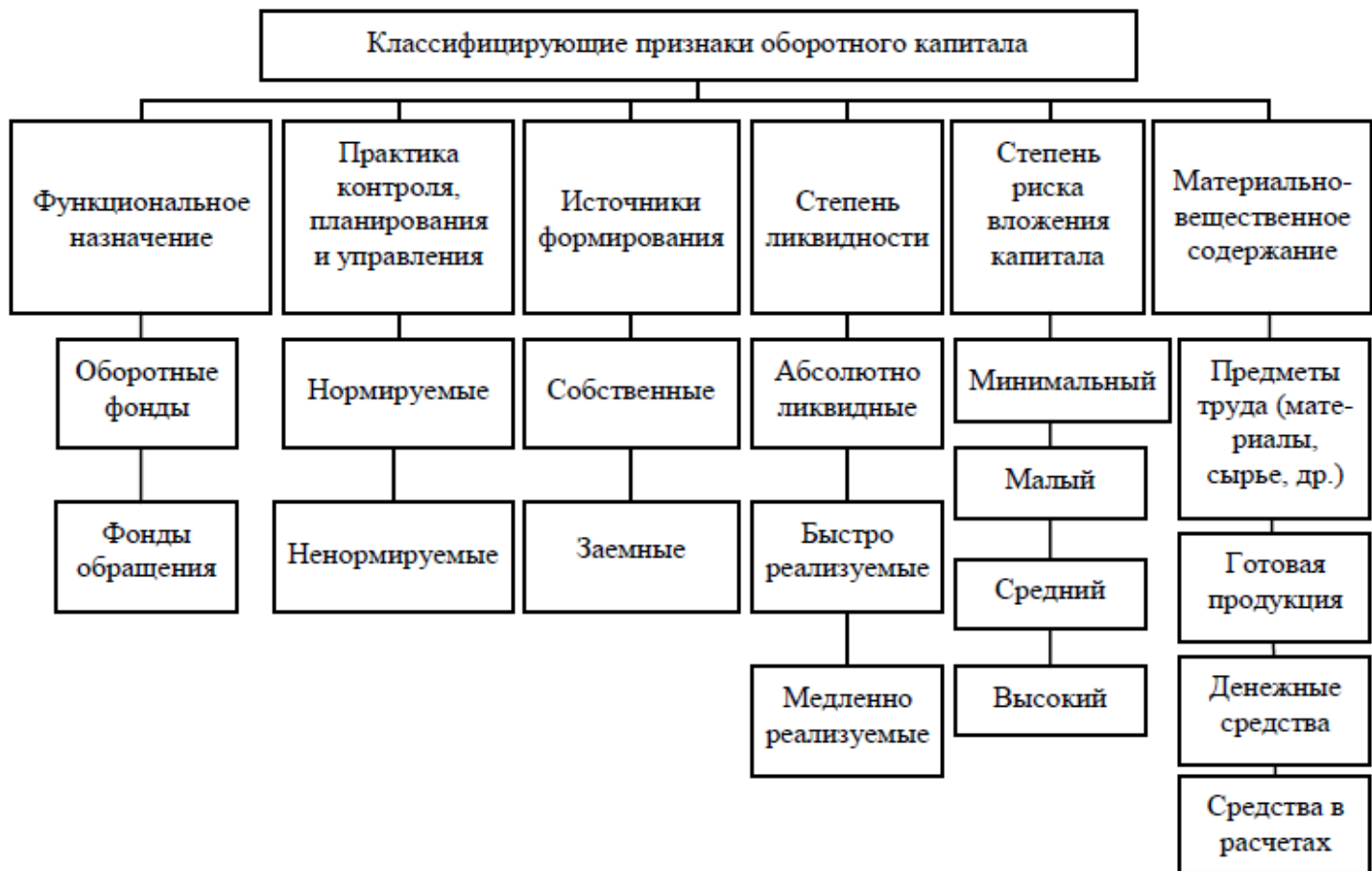
Рис. 1. Признаки, формирующие понятие «оборотный капитал»

Характерными функциональными признаками оборотных средств являются: