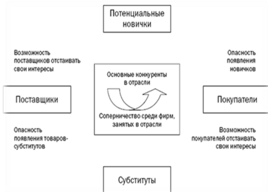
Рисунок 1. Конкурентные силы по М. Портеру.