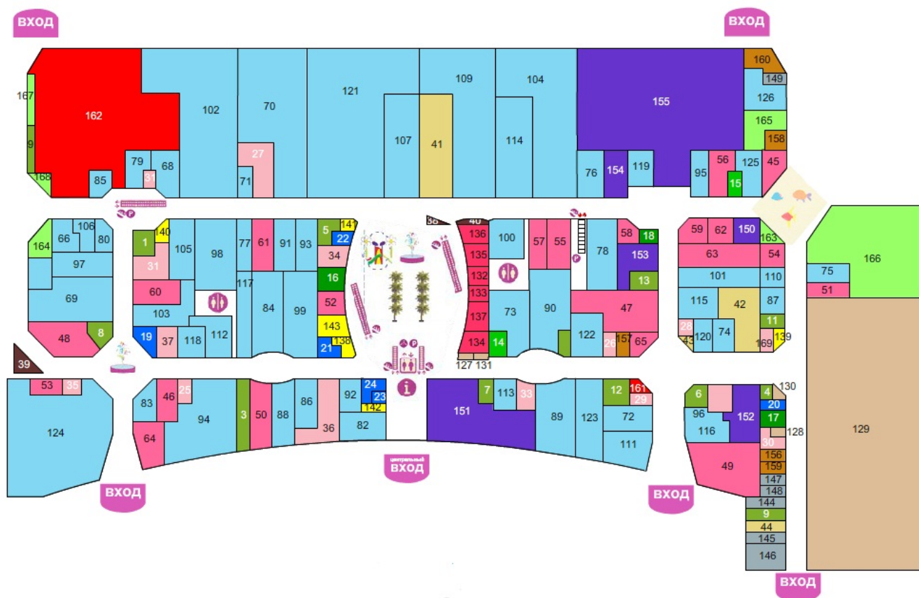
Рисунок 4 - Расположение магазина «Lacoste» и его конкурентов в ТРЦ

Так как исследуемый магазин находится в ТРЦ «Охотный ряд» (№70 на рисунке 4) является арендатором в торговом развлекательном центре «Охотный ряд» он осуществляет прямой контакт с посетителями данного торгового центра.