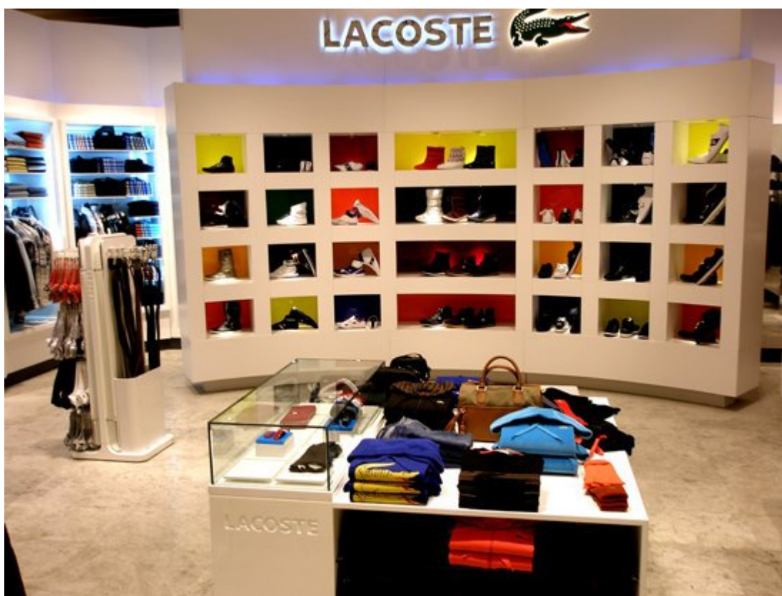
Рисунок 6 – Пристенная панель в магазине «Lacoste»

Торговое оборудование, располагаемое в торговом зале магазина «Lacoste» представлено в виде: пристенных панелей, стеллажей, кронштейнов, островных конструкций, столов и т.д. Все конструкции сборно-разборные - это дает возможность изменять не только выкладку и развеску товаров, но и менять размещение продукции в целом на торговой площади. Факторами, влияющими на размещение торгового оборудования, являются традиции, характер и привлекательность внешнего вида товара, рентабельность, удобство работы для торгового персонала и покупателей.