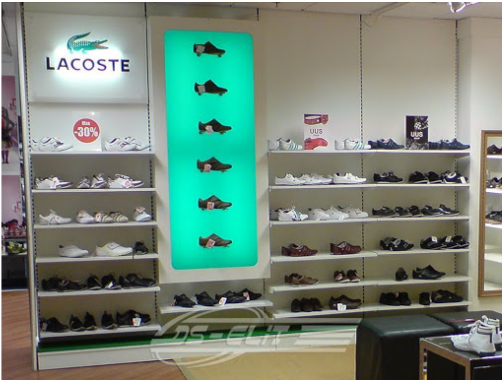
Рисунок 7 –Стеллажи в магазине «Lacoste»