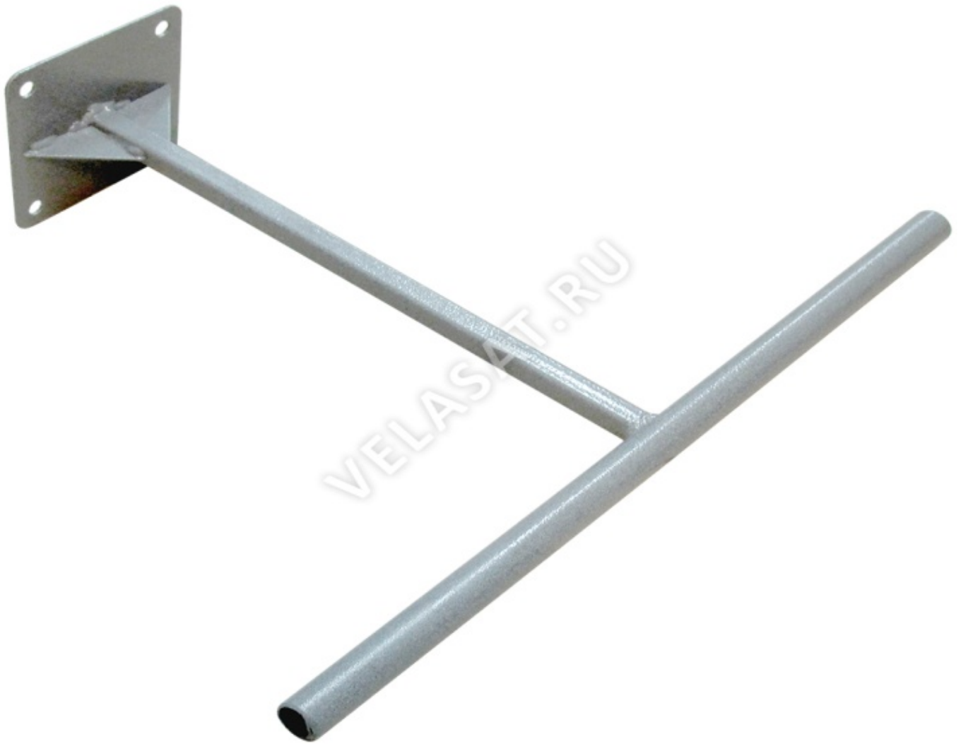
Рисунок 8 - Кронштейн в магазине «Lacoste»