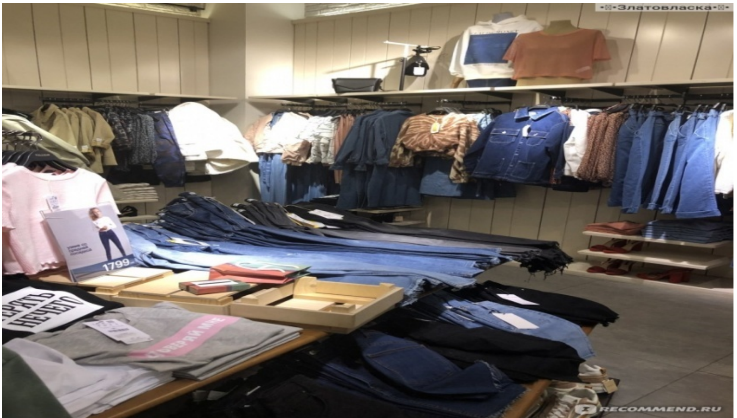
Рисунок 8 – Островные конструкции в магазине «Lacoste»