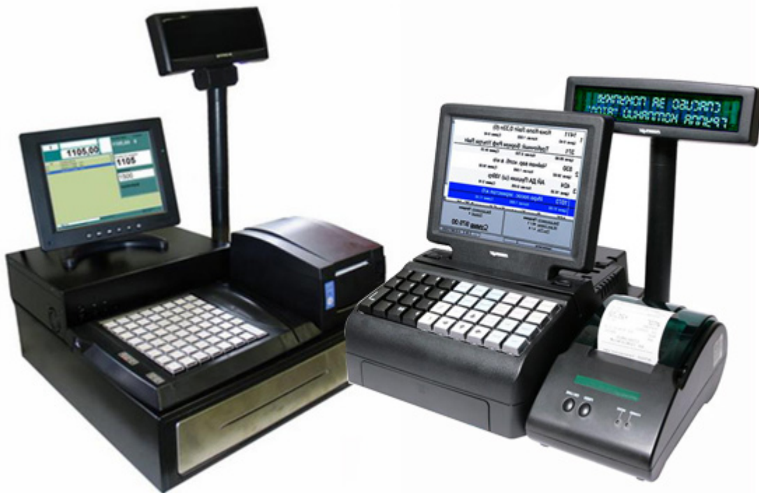
Рисунок 8. Пример контрольно-кассовой машины ООО «Lacoste»

работы путем сравнения фактического и документального остатка.