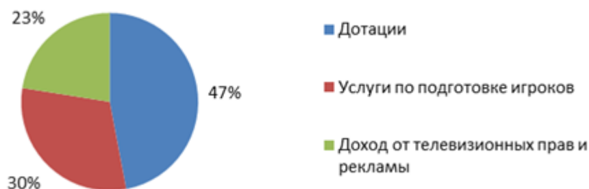
Рисунок 1. Структура бюджета ФК «Ростов»

Болельщикам теперь проще следить за состоянием команды, в частности за травмированными, праздниками внутри команды и т.п. Таким образом клуб ещё ближе подпускает болельщиков к жизни клуба и даёт возможность отслеживать все события внутри команды. В следствии хорошей политики ФК «Ростов» закончили сезон 2015/2016 с чистой прибылью в 51.6 миллионов рублей, хотя два предыдущих года были убыточными (см. рис.1)