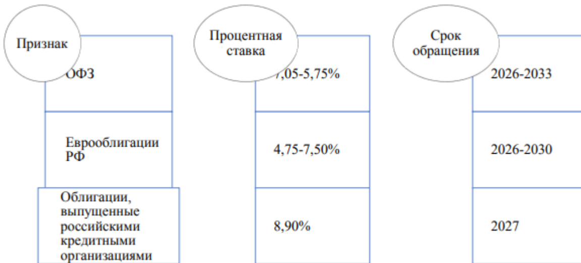
Рисунок 3. Параметры долговых ценных бумаг ЮниКредит Банка.

По состоянию на 31 декабря 2017 года около 89% торговых ценных бумаг, находящихся в портфеле, имели рейтинг не ниже «BBB-» (31 декабря 2016 года: 88%) и включены в ломбардный список Банка России и могут быть использованы в качестве обеспечения по операциям рефинансирования Банка России. Производные финансовые инструменты ЮниКредит Банка по состоянию на 31.12.2017, оцениваемые по справедливой стоимости через прибыли или убыток, представлены на рисунке: