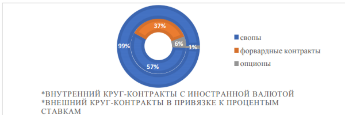
Рисунок 4. Номинальная сумма ПФИ на 31.12.2017 г.

По состоянию на 31 декабря 2017 года около 89% торговых ценных бумаг, находящихся в портфеле, имели рейтинг не ниже «BBB-» (31 декабря 2016 года: 88%) и включены в ломбардный список Банка России и могут быть использованы в качестве обеспечения по операциям рефинансирования Банка России. Производные финансовые инструменты ЮниКредит Банка по состоянию на 31.12.2017, оцениваемые по справедливой стоимости через прибыли или убыток, представлены на рисунке: