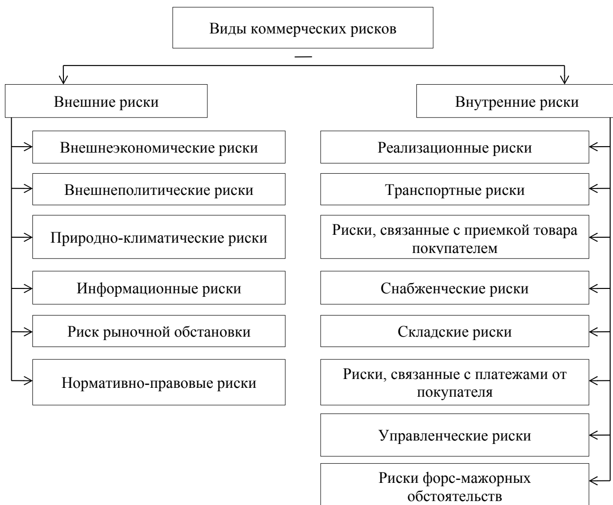
Рис.1. Классификация коммерческих рисков

Согласно рис.1. виды коммерческих рисков состоят из двух групп: внешних и внутренних рисков. Внешнеэкономические и внешнеполитические риски для организаций, не ведущих деятельность на международных рынках, могут иметь только косвенное значение, зато все остальные виды внешних источников угроз могут привести к серьезным потерям. Внутренние риски во многом синхронны ряду логистических направлений деятельности организации: сбытовой, складской, финансовой и транспортной.