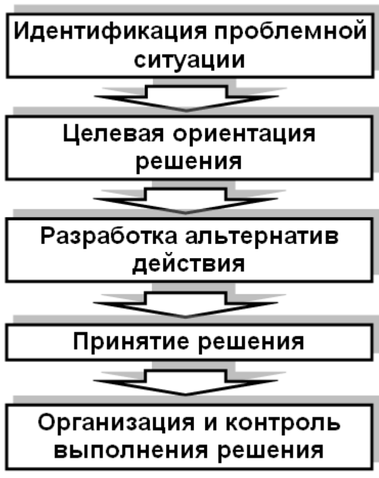
Рисунок 7 - Схема разработки управленческого решения [10]

Таким образом, для принятия управленческих решений в процессе осуществления управляемого стратегического развития спортивной организации определяющее значение имеет стратегический анализ, определение альтернатив и критерии их выбора. Под воздействием нестабильности, которой и характеризуется современная управленческая среда, невозможно принятие управленческого решения как решения административного (в том аспекте, что управление сегодня не может идти по пути исключительно административных методов, оно должно быть гибким и мобильным в зависимости от изменений внутренней и внешней среды объекта управления), именно поэтому каждое управленческое решение вариативно – есть проблема, которую необходимо решить, существует определенный «набор» альтернатив, среди которых необходимо определить наиболее приемлемую. Стратегический анализ является необходимым первоначальным элементом принятия управленческого решения в современных условиях. Главной его целью является информация об угрозах и возможностях, которую надо учитывать при принятии всех ключевых стратегических решений. Объектом стратегического анализа при принятии управленческого решения