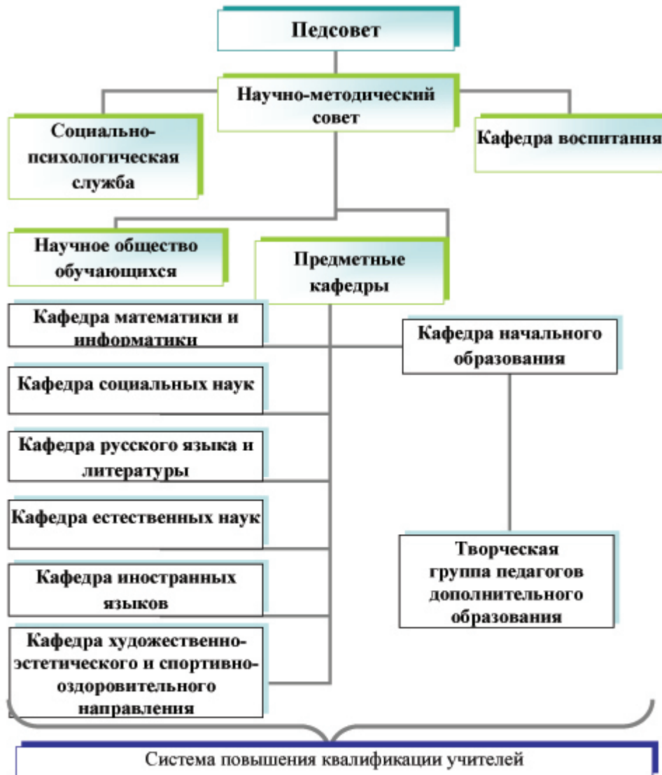
Состав структурных подразделений методической службы ГБОУ «ЦСиО «Самбо-70» Москомспорта