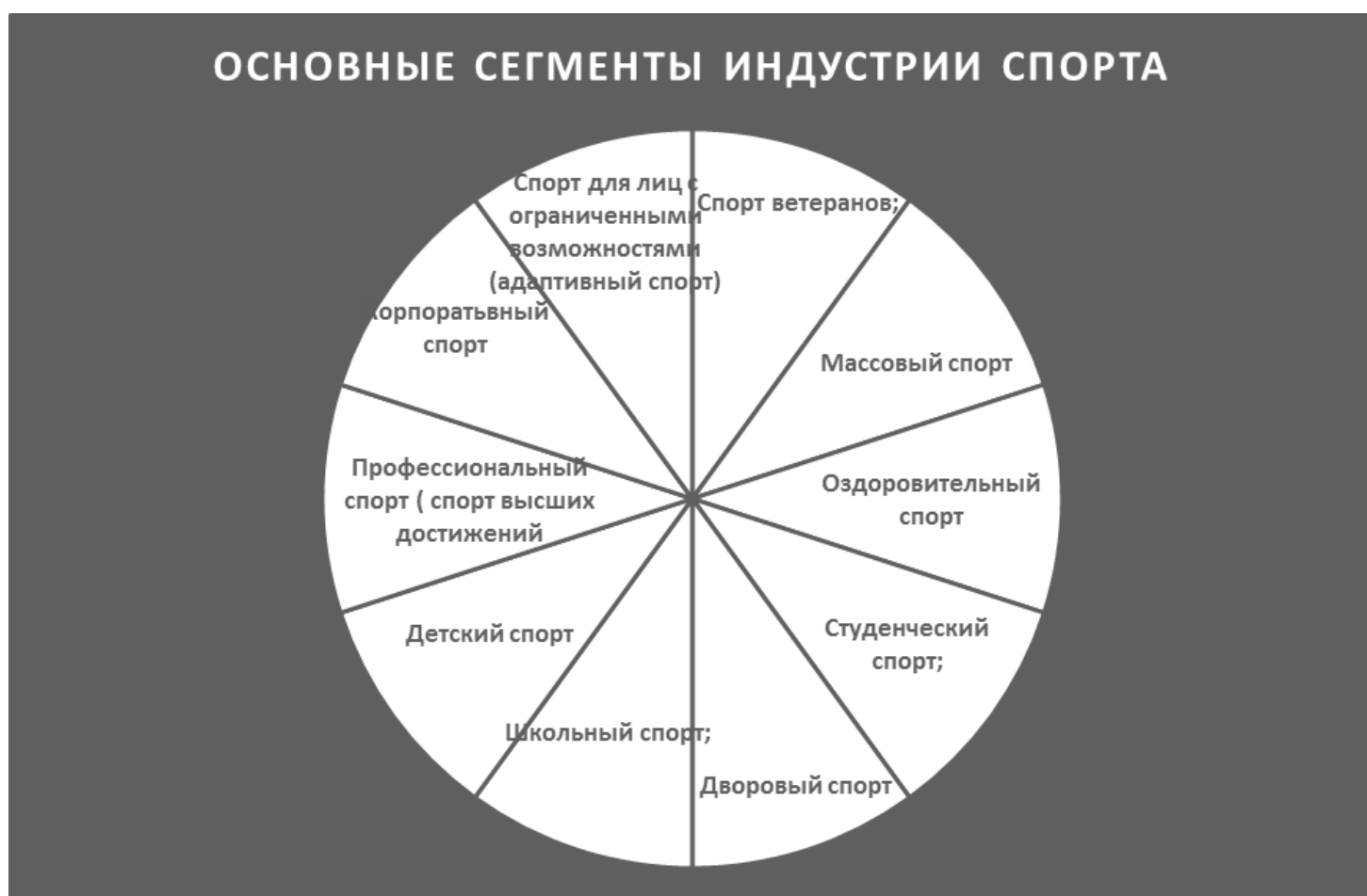
Рис.1 Основные сегменты индустрии спорта

Все сегменты в индустрии спорта являются потенциальными местами трудоустройства будущих спортивных менеджеров.