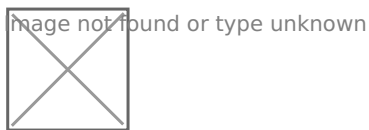
Рисунок 2. Объем оказанных услуг ООО «Атлантис» в

Динамика объема оказанных услуг ООО «Атлантис» показана на рисунке 2.