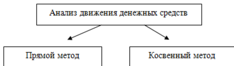
Рисунок 2 – Методы анализа движения денежных средств

Анализ движения денежных средств может проводиться прямым и косвенным методами (рисунок 2).