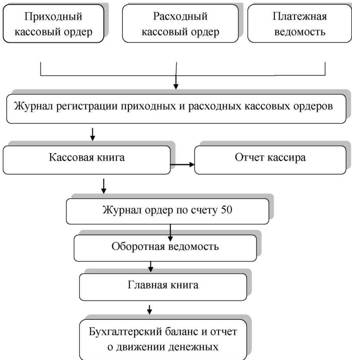
Рисунок 2 - Документооборот по учету кассовых операций[10]

В бухгалтерском учете операции по поступлению денежных средств в кассу организации отражаются бухгалтерскими записями с использованием специализированных счетов бухгалтерского учета.