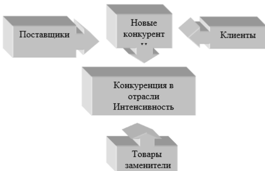
Рисунок 3 - Пять сил конкуренции

Новые конкуренты. Их появление в отрасли могут предупредить следующие входные барьеры: [15]