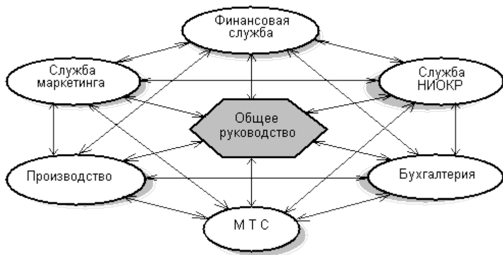
Рисунок 1 - Внутренняя среда фирмы

Глубокий и тщательный анализ внутренней среды является необходимой предпосылкой для принятия управленческих решений. Экономическая информация является конкретным выражением процессов, происходящих внутри фирмы. Без такой информации и анализа, невозможно эффективно работать и развивать производственно-сбытовой деятельности компании.