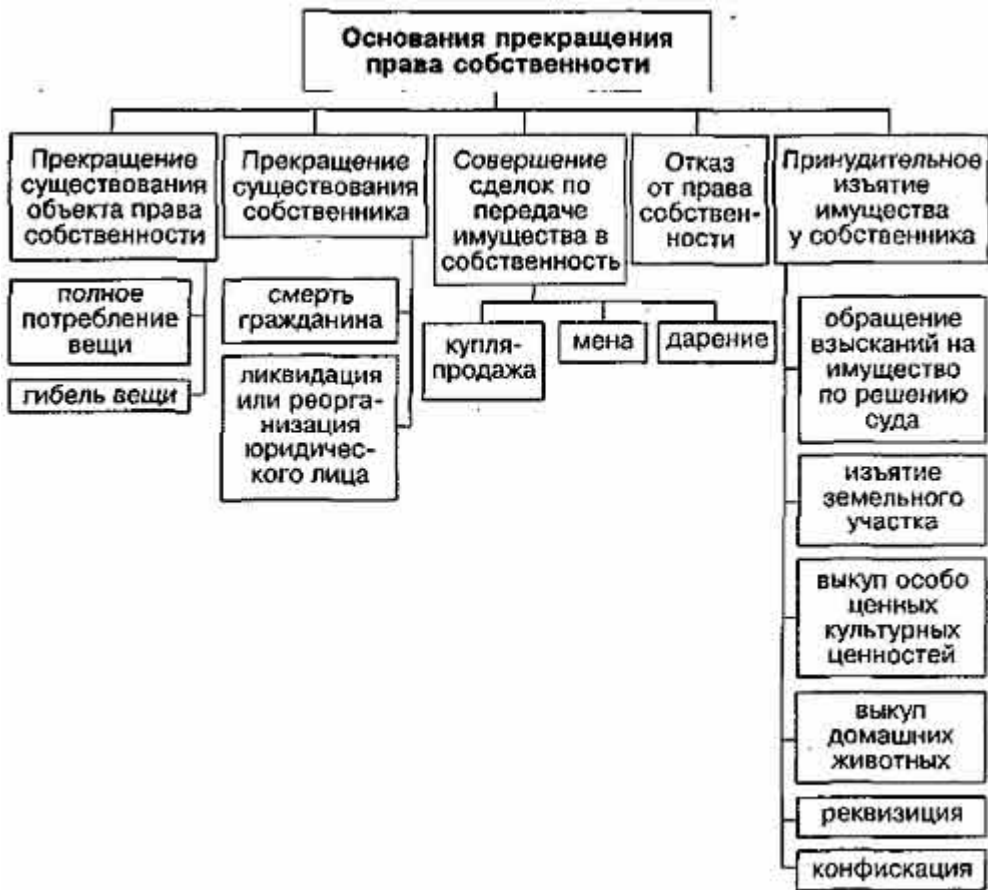
Схема: Основания прекращения права собственности