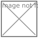
Рисунок 1 - Схема работы бюро кредитных историй