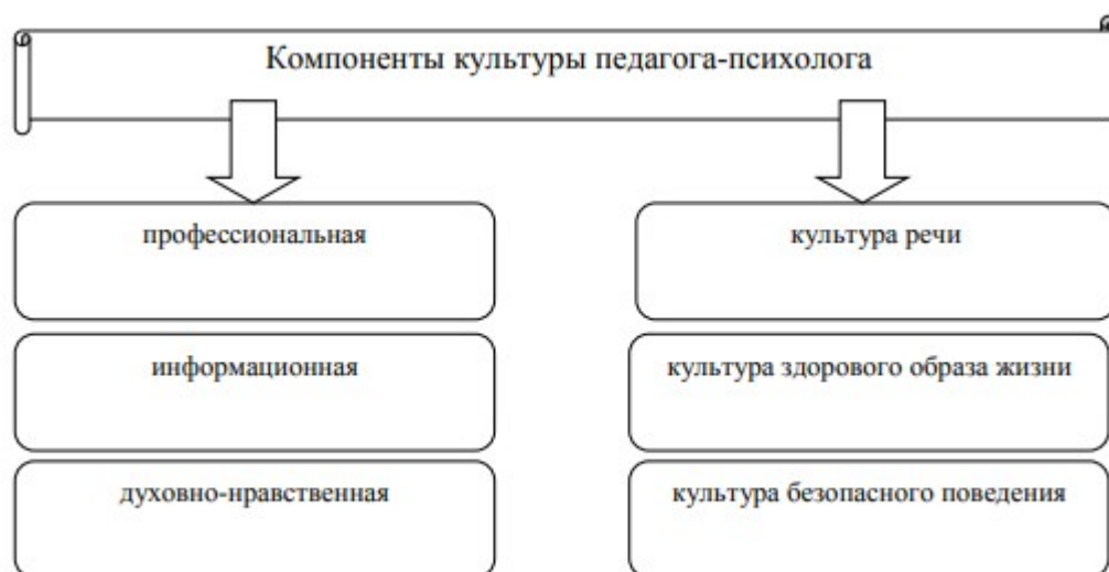
Рисунок 1 - Компоненты культуры педагога-психолога

Профессиональная культура педагога-психолога представляет собой синтез профессиональной компетенции, профессионально важных качеств педагога-психолога, мотивационно-ценностного отношения к психолого-педагогической деятельности, специфических видов и способов поведения, которые обеспечивают творческое решение психолого-педагогических задач.