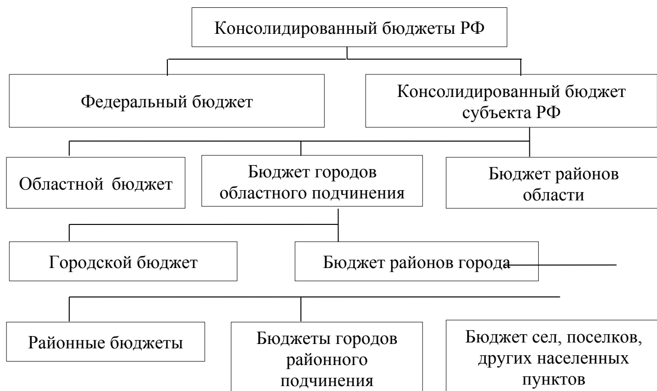
Рисунок 1.3. – Структура консолидированного бюджета

Консолидированный бюджет Российской Федерации федеральный бюджет и свод консолидированных бюджетов бюджетной системы Российской Федерации (без учета межбюджетных трансфертов между этими бюджетами) (рис. 1.3).