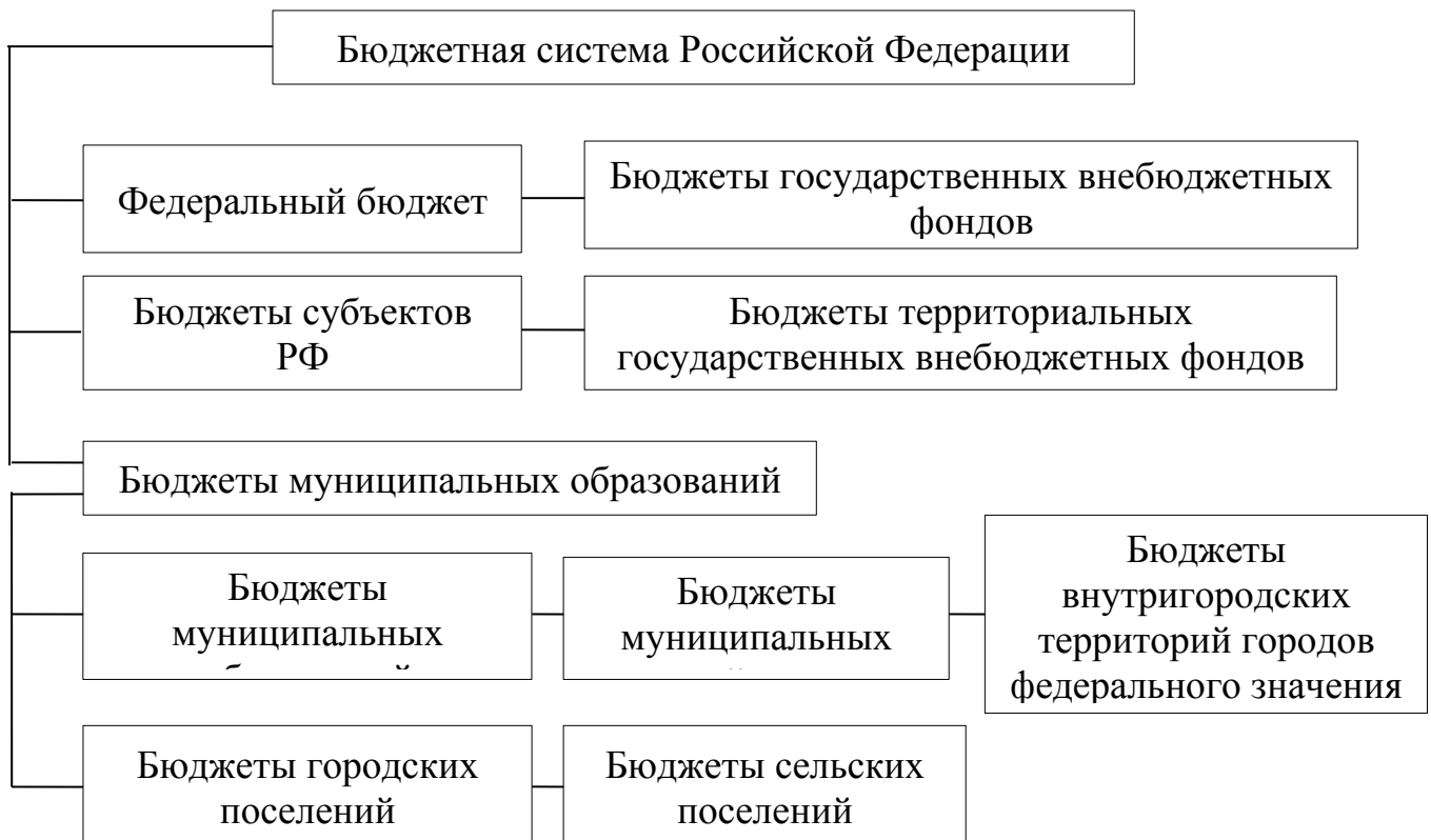
Рисунок 1.2. – Структура бюджетной системы РФ

Бюджетный кодекс РФ закрепляет трехуровневую структуру бюджетной системы Российской Федерации (рис.1.2).