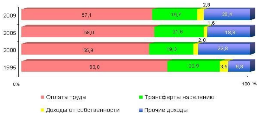
Рисунок 1. Структура денежных доходов населения (в процентах к итогу)