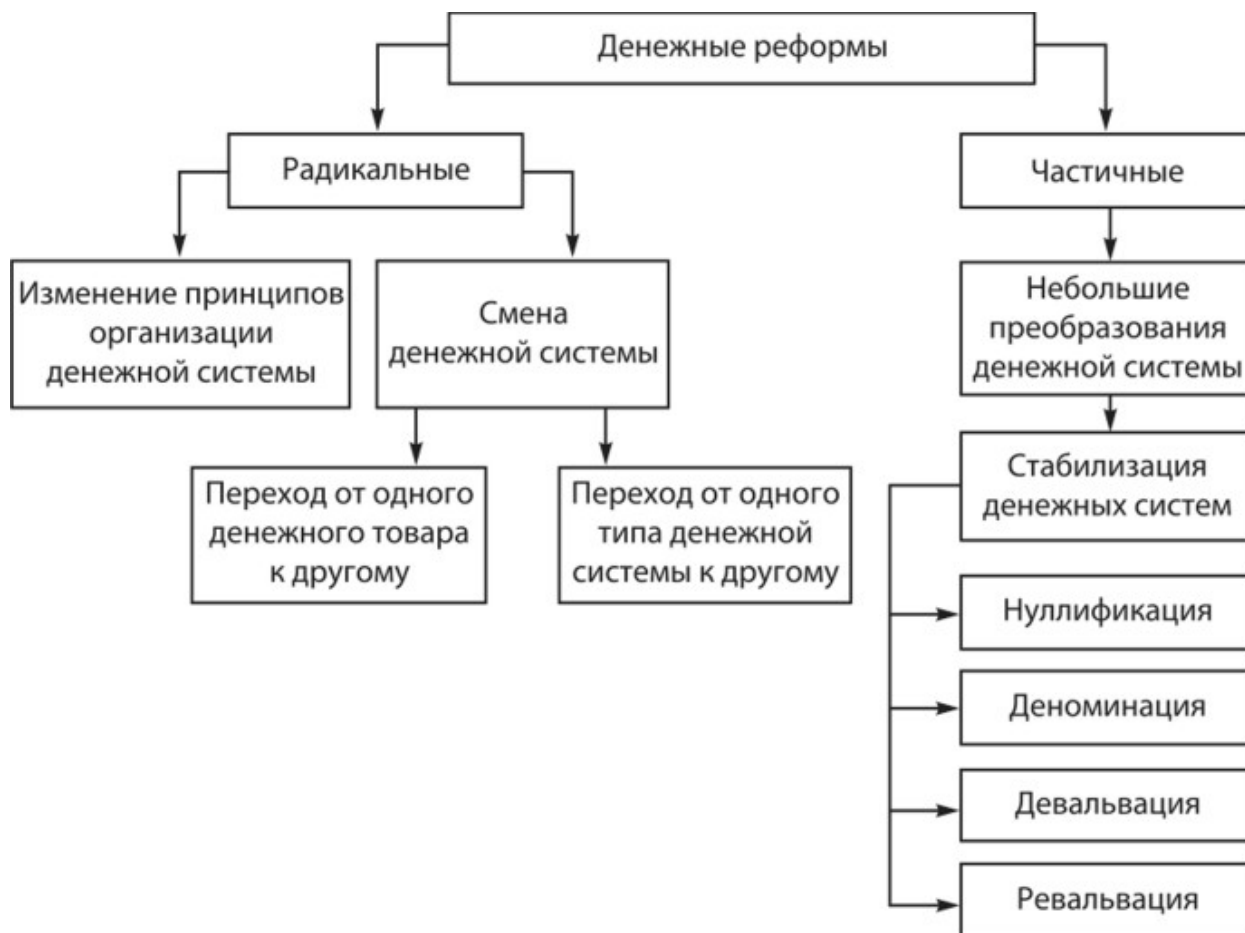
Рисунок 1 – Типы и методы денежных реформ

Выделяют следующие классические методы проведения денежных реформ: