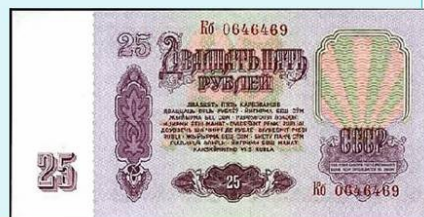
Рисунок 3 – Денежная реформа в СССР 1961 года

К отрицательным последствиям реформы – как прямым, так и побочным – можно отнести стабильно высокие цены на импортные товары, которые оставались таковыми долгие годы. Уровень оплаты труда при этом – по сравнению со странами Восточной и Западной Европы – был невысоким. Главным негативным последствием стало изменение официального золотого содержания (обеспечения) рубля. Номинал рубля вырос в 10 раз, но до реформы золотое обеспечение рубля составляло 0,2г, а после реформы – 0,9г.